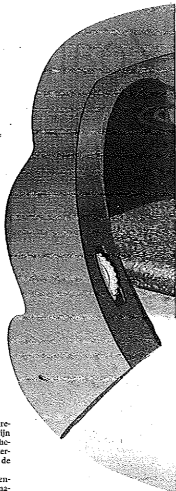
ILLUSTRATIE STUDIO NCRK/VAN SCHAGEN

E ERST EEN misverstand uit de weg ruimen. Op sommige scholen leren kinderen nog steeds dat we zoet proeven op het puntje van de tong, bitter achterop de tong en zuur en zout aan de zijkanalen. Maar met smaakpanels is al zo'n twintig jaar geleden aangetoond dat dat niet klopt.